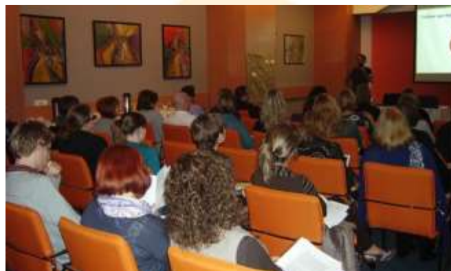
Medzinárodná konferencia učiteľov a učiteľiek psychológie v Bratislave r. 2010