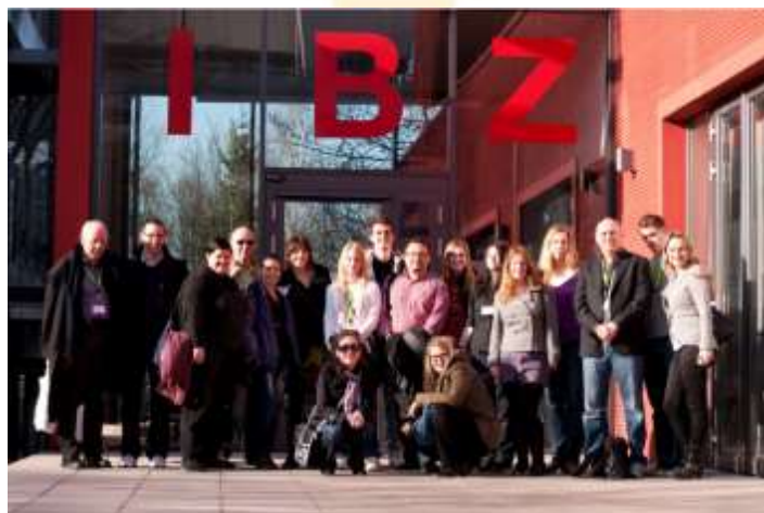
Jeden z výsledkov medzinárodnej spolupráce – jarná škola študentov a študentiek učiteľstva psychológie v Dortmunde za účasti slovenských študentov a študentiek (r. 2011)